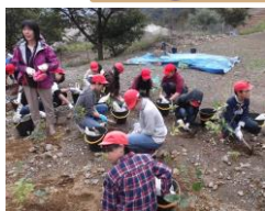
植樹体験 (足尾にて)